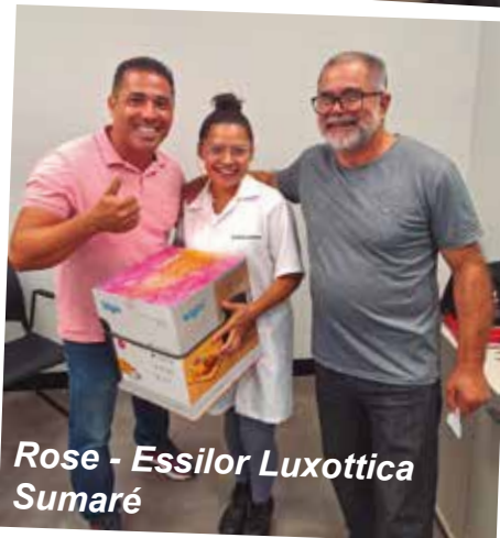
Rose - Essilor Luxottica Sumaré