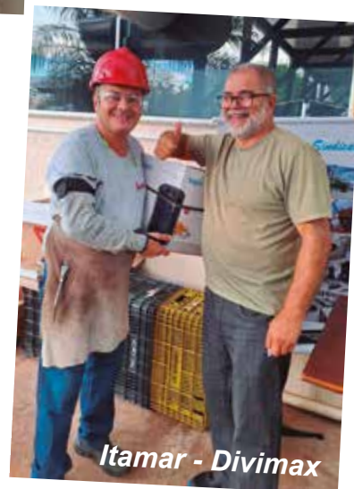
Itamar - Divimax