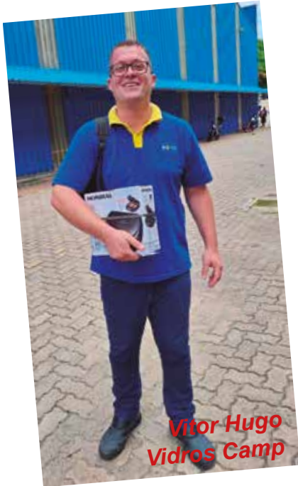
Vitor Hugo Vidros Camp

Confira aqui os sortudos da vez. Você não apareceu nas fotos? Não se preocupe. Fique sócio do Sindividro hoje mesmo. E como sabemos que você é uma pessoa de sorte, no próximo sorteio você estará entre os premiados.