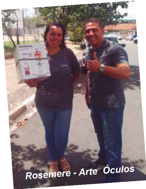
Rosemere - Arte Óculos